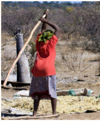
Njia duni au isiyofaa